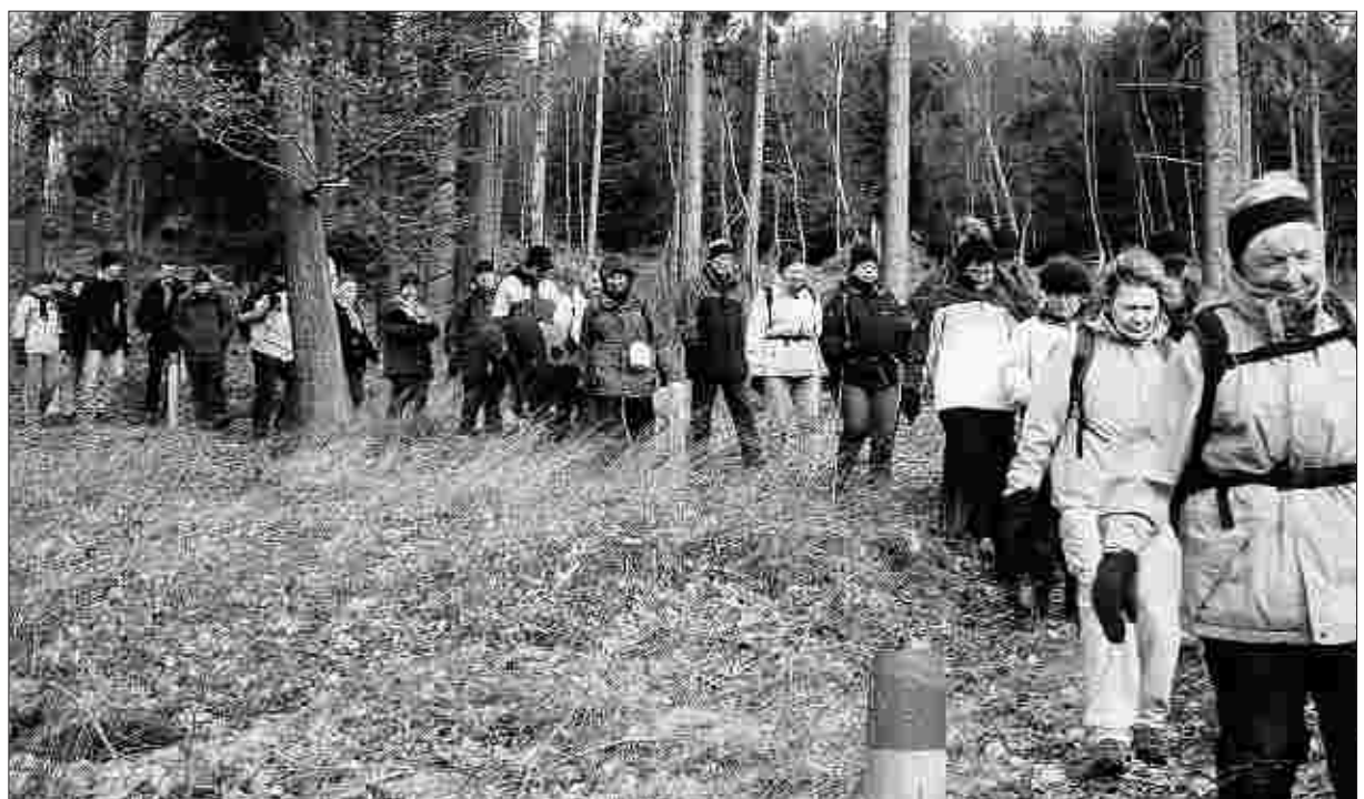
Die Winterwandertage des Lammersdorfer Eifelvereins fanden erneut großen Zuspruch. Besonders gut besucht waren die Touren durch den Nationalpark.

Infos: 0800 - 2222 800 oder www.netcologne.de