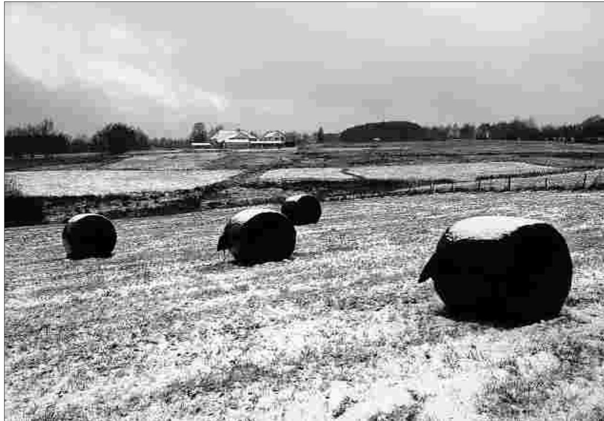
Ein Minimum an Schneefall, aber viel Sonnenschein und Kälte bestimmten das Wettergeschehen in der Nordeifel im Monat Dezember 2007.

Die Jahresmitteltemperaturen lagen aber im Kreis Aachen z. T. mehr als 1 Grad zu hoch. So wurden im Stadtgebiet Aachen 11,2 Grad gemessen (Mittel 10,1 Grad) und in Simmerath-Strauch 9,1 Grad statt 7,7 Grad.