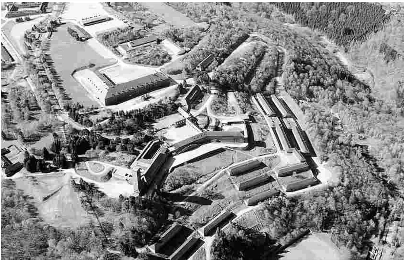
In und um Vogelsang im Nationalpark Eifel findet am 25. Mai der diesjährige Tag der Parke statt.