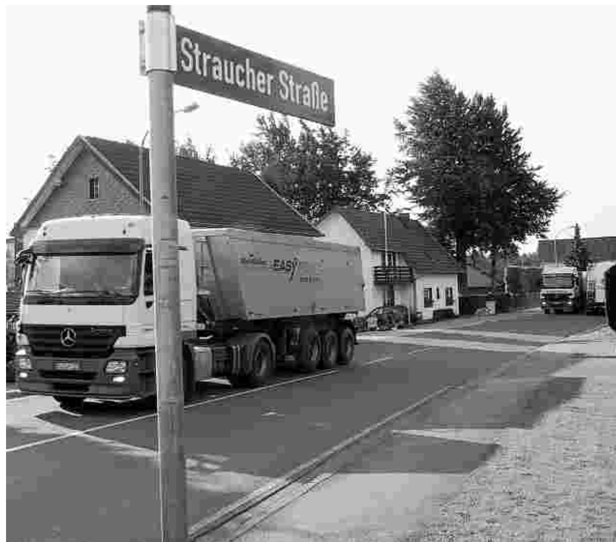
Auf der Straucher Straße in Kesternich herrscht Dauerverkehr; auch die Zahl der Lkws ist gestiegen. Für die Anwohner darf eine Umgehungsstraße nicht länger auf sich warten lassen.