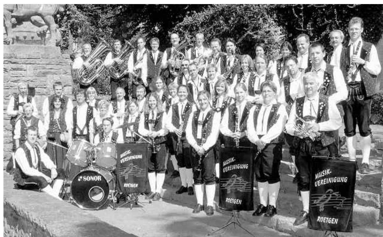
Das Haupt- und das Jugendorchester des MV Roetgen geben am Samstag, 31. Oktober, ihr großes Konzert.