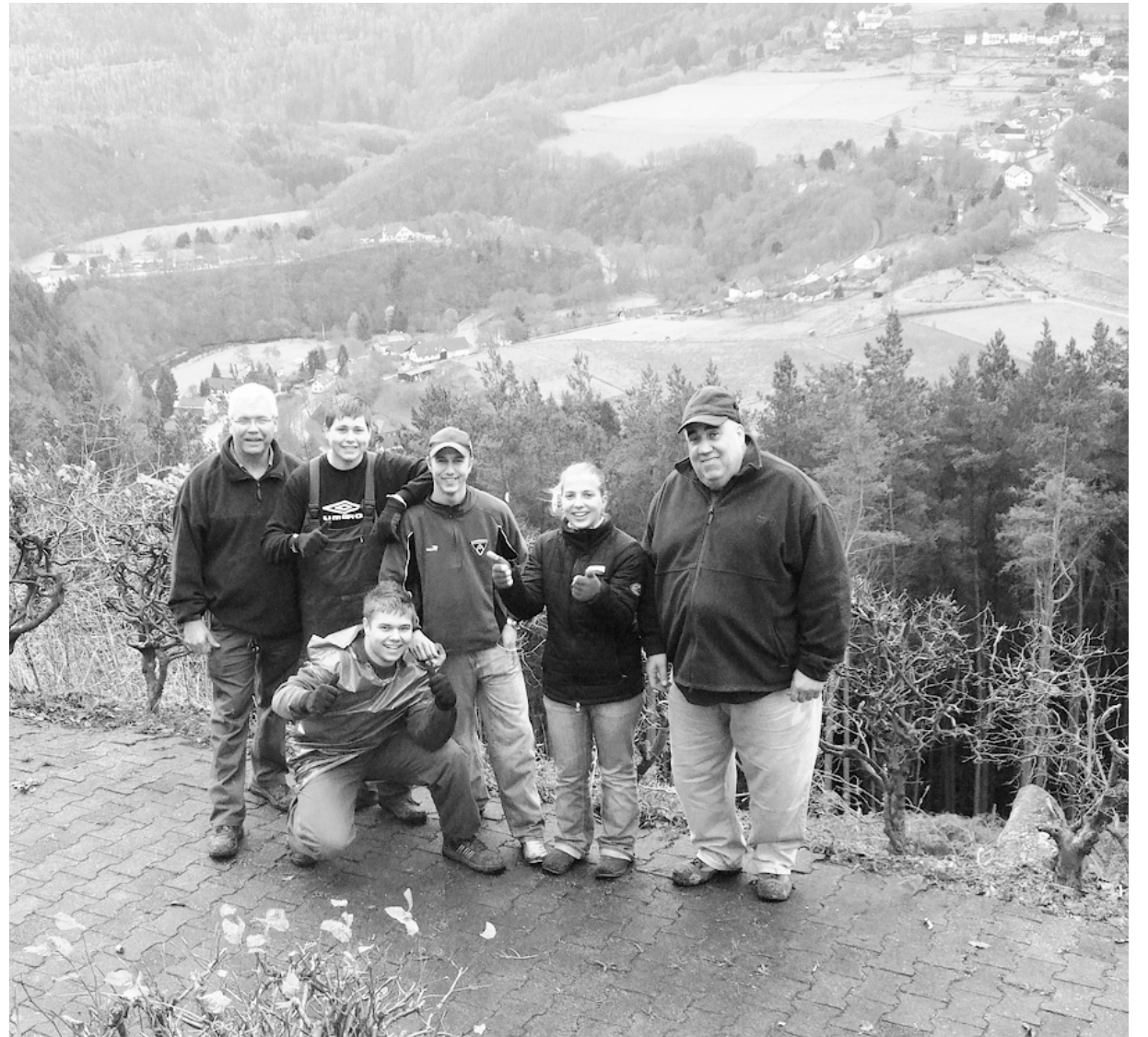
Aufgeräumt: Die St. Michael Schützenjugend hat fleißig Müll gesammelt und aus einem Schandfleck wieder einen schönen Aussichtspunkt gemacht.

Unverzüglich erschien auch den Helfern, dass einige Zeitgenossen ihren Gartenabfall und das