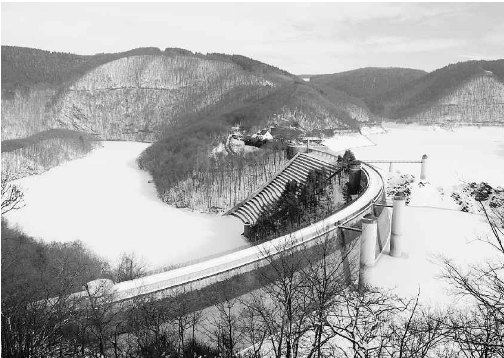
Ein idyllisches Bild bietet die verschneite Urfttalsperre. Selbst bei einer schnellen Schneeschmelze dürfte es in den Talsperren keine Probleme geben.