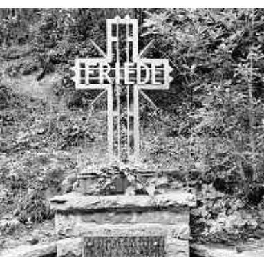
Ein Kreuz an der Straße zwischen Simonskall und Vossenack erinnert an die Brände 1947.

Schon im Frühjahr 1947 hatten Großfeuer zahlreiche Häuser mit strohgedeckten Dächern zerstört. So war die Zollsiedlung in Kaltherberg zerstört, Ende April wurden sechs Wohnhäuser in Pausenbach Opfer der Feuersbrunst. Zahlreiche Feuerwehren hatten Abordnungen nach Kesternich entsandt, um ihrem Kameraden Stollenwerk die letzte Ehre zu erweisen. Der Bericht der Lokalzeitung vom 23. September 1947 endete mit: „Besonderen Dank verdient die Wehr von Kesternich, die alles einsetzte, um den letzten Gang des Toten würdig zu gestalten und der Witwe, die mit vier unmündigen Kindern zurückgeblieben war, das harte Schicksal zu erleichtern.“