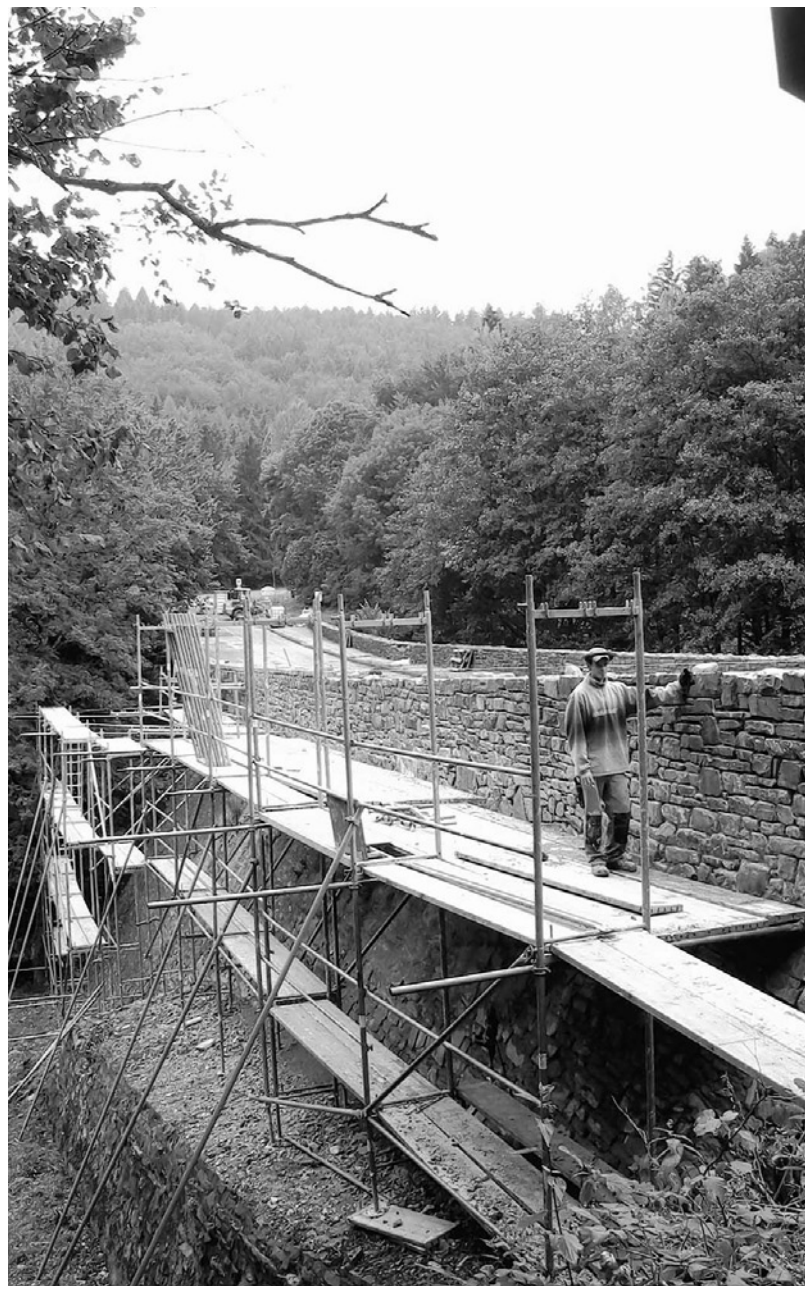
Bruchsteine müssen erneuert werden: Die kleine Kallbachbrücke ist ein prominentes Bauwerk, das nicht verfallen soll.

Eine Bauzeit von drei Monaten hatte der Landesbetrieb Straßen-