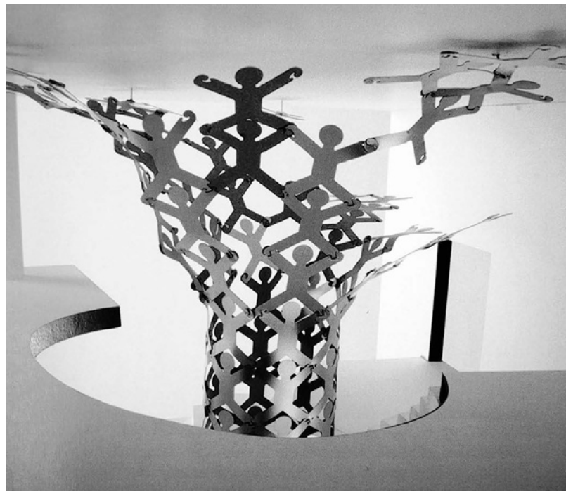
Schematisierte, menschenförmige Figuren: Für seine aus Aluminiumblech gestaltete Menschenpyramide wurde der 24-jährige Didier Gehlen aus Monschau mit dem Förderpreis im Rahmen der EVBK-Ausstellung in Prüm ausgezeichnet.