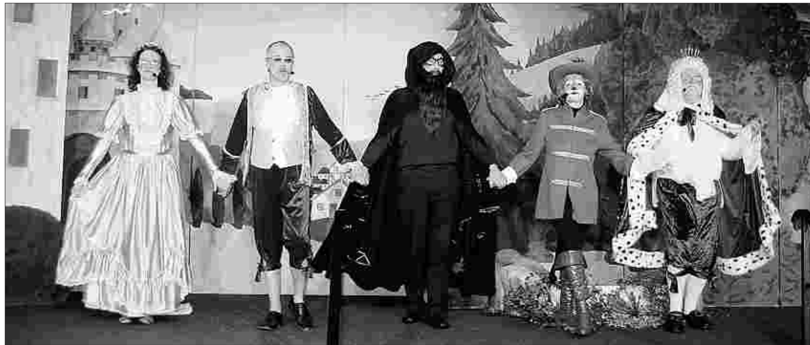
Die Schauspieler der Krähenbühne Elsenborn überzeugten am Samstag in der Vereinshalle in Kalterherberg und bescherten nicht nur den jungen Zuschauern einen kurzweiligen Abend.

Das Repertoire der Krähenbühne setzt sich zusammen aus Stücken für Erwachsene, die im Abstand von zwei Jahren neu aufgelegt werden. Mit diesen Stücken ist die Krähenbühne Elsenborn bereits in der Vergangenheit auch in Kalterherberg aufgetreten. „Den Akteuren war der Zwei-Jahres-