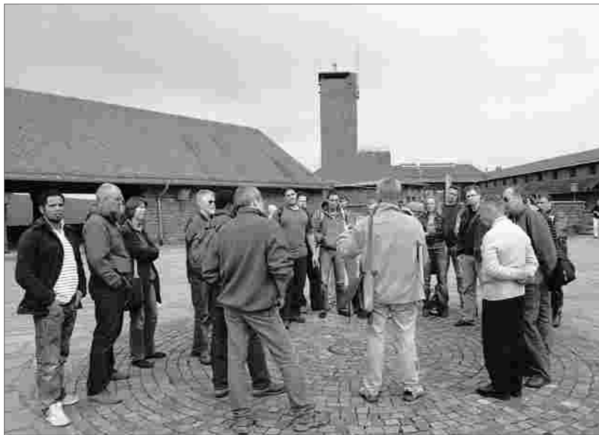
Touristenmagnet: Rund 71 000 Menschen haben 2007 an Führungen auf dem Vogelsang-Gelände teilgenommen, das sind 42 Prozent mehr als im Jahr zuvor. Insgesamt kamen 185 000 Besucher.