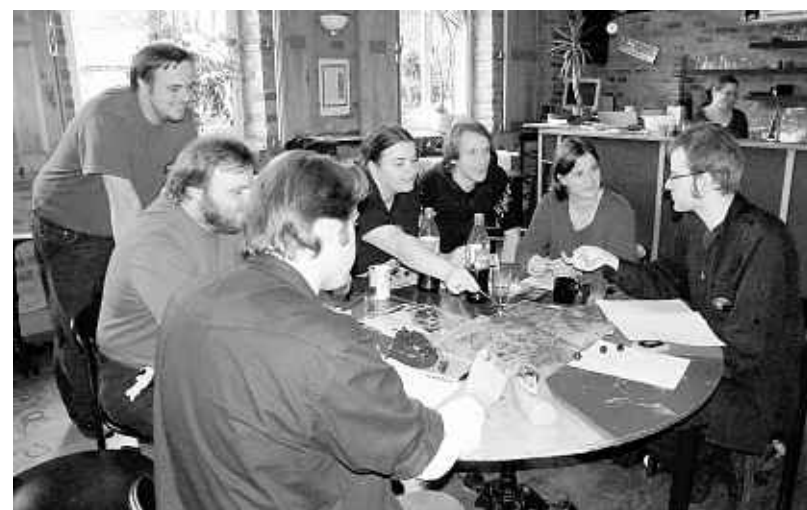
Die Rollenspieler in Aktion im Bischof-Vogt-Haus.

Veranstaltet wurde dieses Zusammenreffen vom Verein Condra e.V. und von den DORPs, Menschen zwischen 25 und 30 Jahren, die dies bereits seit 1995 betreiben und sichtbar Spaß daran haben. (ck)