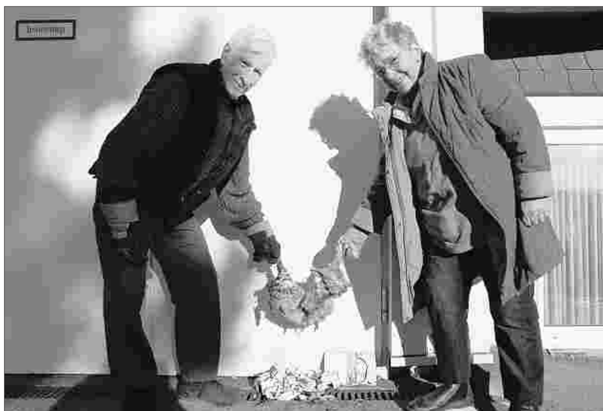
Einen makaberen Fund machten die Eheleute Klein am Montagmorgen auf dem großen Parkplatz im Ortskern von Imgenbroich.

Auf den oder die Täter gibt es bislang keine Hinweise.