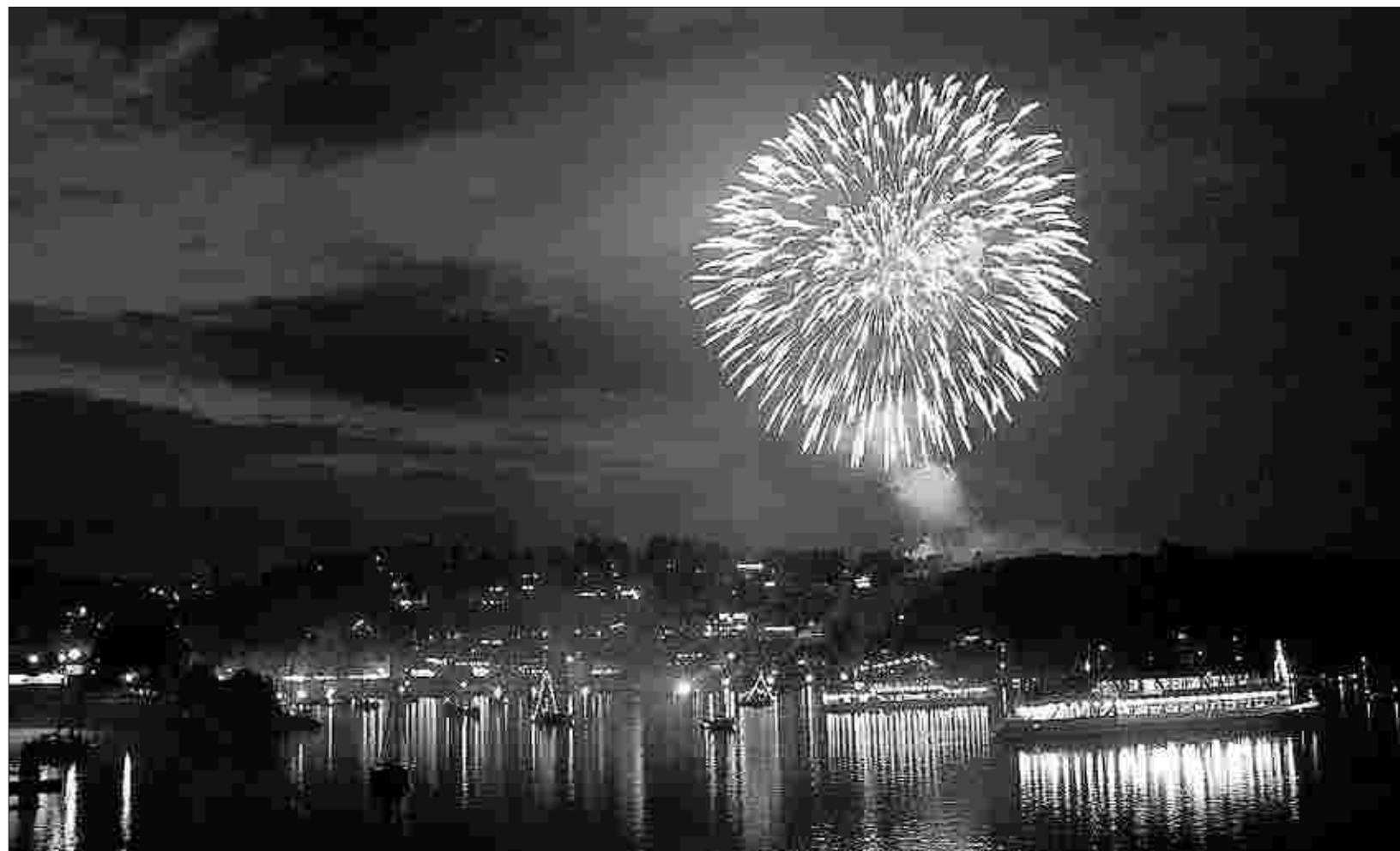
Der glanzvolle und krönende Abschluss des Spektakels Rursee in Flammen ist natürlich das Feuerwerk, das den Rursee in ein Meer von Farben tauchte.

In Woffelsbach spielt sich der gemütlichere Teil des Festes ab. Im Ortskern standen einige Wiesen, teilweise kostenlos, als Parkflächen zur Verfügung. Dafür konnte man das Geld an anderer Stelle ausgeben. Der Trödelmarkt am