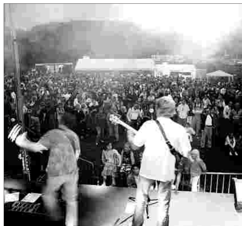
Die Coverband „For Example“ ist seit Jahren ein Stimmungsgarant beim Rurseefest. Diesmal beschallte sie die Massen am Rurseezentrum.

Der milde Sommerabend strebte dann seinem Höhepunkt entgegen als die Dunkelheit hereinbrach. Für das Höhenfeuerwerk bezogen die Schaulustigen Position. Wenn auch mit dem ersten Böller die ersten Regenschirmen