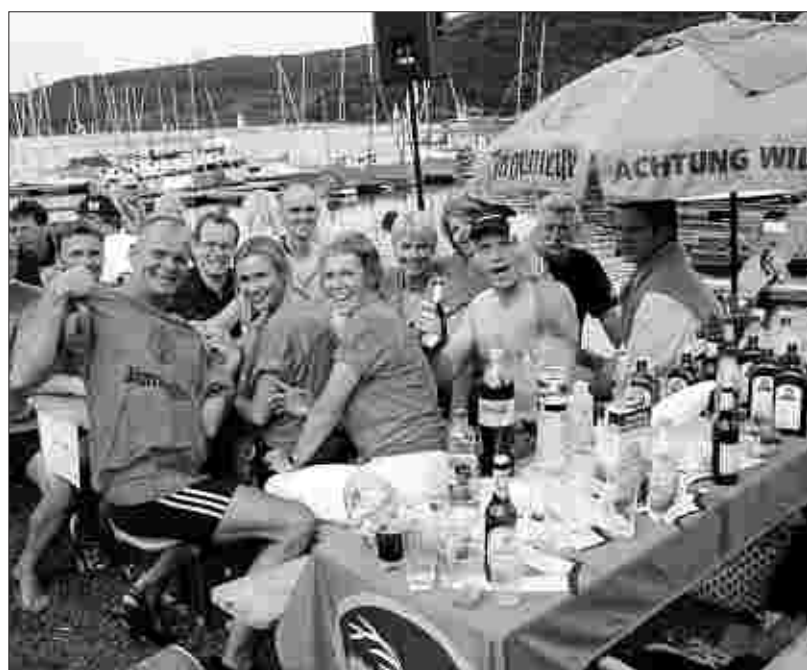
Den Stimmungspegel ansteigen ließen so einige Teams des Drachenbootrennens, die in der Woffelsbacher Bucht Party machten.