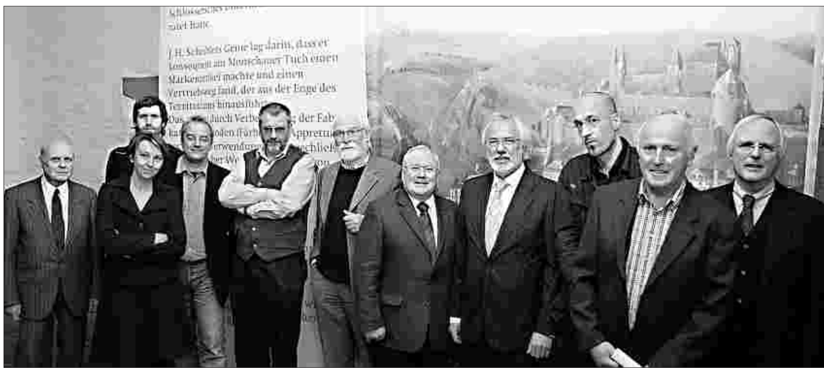
Die Ausstellung „Tuchmachertradition in Monschau: von Häusern und Menschen“ ging nun zu Ende. Die Beteiligten denken jetzt darüber nach, ein Tuchmachermuseum in Monschau einzurichten.

Das große Interesse der Bevölkerung und der Besucher habe die