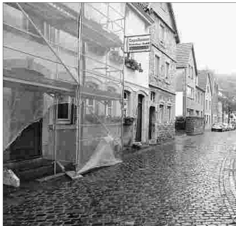
Die Idylle trägt: Über die beschauliche – aber nicht gerade ausladende – Korneliusstraße soll der Durchgangsverkehr bis auf weiteres fließen.

Und so bleiben die Verantwortlichen zuversichtlich, dass das große Chaos am Indeufer weitgehend ausbleibt. Am Ende werde die neue Brücke nicht nur den Autofahrern Freude bereiten: „Für die Gestaltung des Geländes haben wir eigens einen Architekten beauftragt“, sagt Planer Helmut Helzle. „Außerdem wird die Brücke im unteren Bereich mit Bruchsteinen verschönert.“ Schließlich werde auch ein Radweg angelegt.