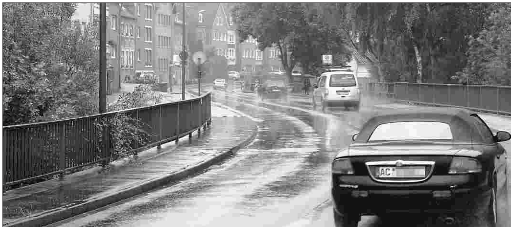
Dringend sanierungsbedürftig: Die Indebrücke in Kornelimünster soll spätestens ab November komplett gesperrt werden. Mindestens zehn Monate lang muss der Verkehr umgeleitet werden. Lkw über 21 Tonnen dürfen die Brücke schon seit langem nicht mehr passieren.

Ebenso wie Koch akzeptiert Alice Brammertz, Mitinhaberin der gleichnamigen Schreinerei, dass der Neubau unvermeidlich sei. „Aber wir haben große Sorge, dass die Sperrung sich über weit mehr als zehn oder elf Monate hinzieht.“